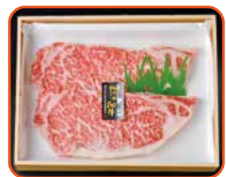
「福岡県ウェブ物産展」の博多和牛ロースステーキ