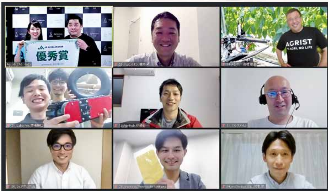
優秀賞を受賞した8社の皆さん(左上は主催者)