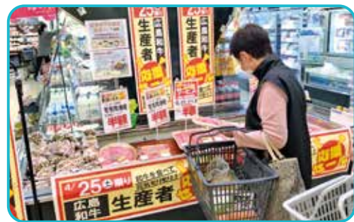
広島和牛生産者応援セールの商品を手にする買い物客

観光客や外食機会の減少により和牛の需要は低迷し、枝肉価格が下落しており、生産者の経営悪化が懸