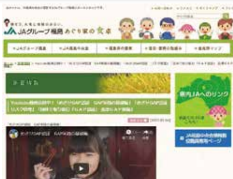
JAグループ福島「あぐり家の食卓」のホームページはこちら https://www.ja-fc.or.jp/

新型コロナウイルスの感染が大する中、GAPの推進活動や取得支援も影響が避けられない情勢となっています。そのような状況の中でも、GAPに対する理解が醸成できるように、以前からJAグループ福島で作成していたDVDをホームページ上(JAグループ福島「あぐり家の食卓」)に公開しました。内容は「基礎編」「リスク管理編」「団体認証編」に分かれており、テーマごとに学ぶことができます。