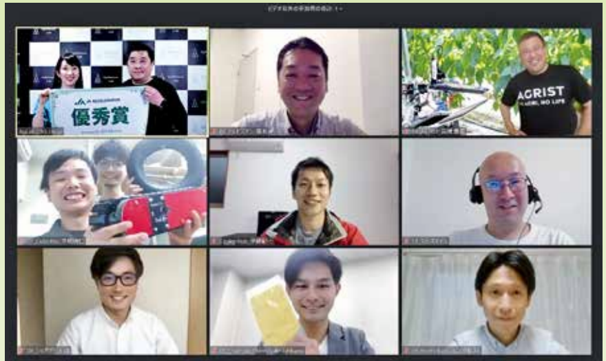
オンラインで行われたJAアクセラレータープログラムの最終審査コンテストで優秀賞を受賞し採択された8社の皆さん=左上は主催者(4-5面)