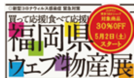
「福岡県ウェブ物産展」特設ページ

ンドの「博多和牛」、「はかた地どり」、乳製品では「アイスクリーム」、そして季節に彩りを添える「花」などを販売しています。今後は「八女の新茶」や旬の果物「いちじく」「もも」などを随時追加し、福岡県産農畜産物の消費拡大に取り組んでまいります。