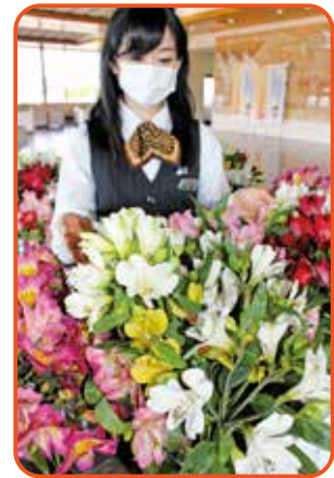
農協会館に花きを展示

他にも、青森県庁や県農協会館内の関連団体でも展示しています。この取り組みは、株式会社大田花きが農林水産省の補助事業で行っている「花きの長期保管技術実証事業」を一部活用しています。花きの需要低迷は今後、長期化することが懸念されるため、青森県本部は事業終了後も独自の取り組みとして継続することとしています。