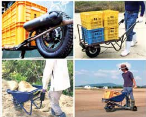
(株)CuboRexの運搬一輪車電動化キット「E-cat kit」