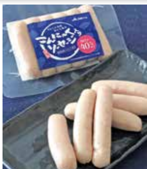
「こんにゃく入りソーセージ」6本入り(120g 2 )希望小売価格：税別298円

こんにゃく製造販売会社とコラボし、群馬県産こんにゃくと国産豚・鶏肉を使用したあらびきタイプのソーセージです。カロリーオフ(同社通常ソーセージ比40%オフ)なのに肉のジューシーさがあり、こんにゃくのコリコリとした食感を追求しました。原料のこんにゃくは臭みもほとんどなく、ソーセージとの相性は抜群で、ボイルしても焼いてもおいしく食べられます。和風の味付けなので、焼き焼きやおでんの具材としてもお勧めです。 今後、健康志向が高まる消費者ニーズに応え、シリーズ化など商品展開を目指します。