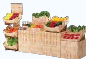
段ボール製ディスプレイ「マルシェキット」

お問い合わせは、JA全農 耕種資材部 資材課まで (Tel : 03-6271-8322)。