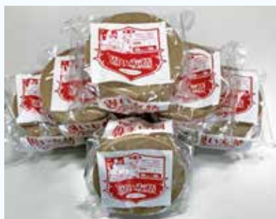
クラフトテープ「固い友情」

「固い友情」は、全農が開発したオリジナル一般用クラフトテープです。このテープは国内製造にこだわり、表面にラミネート加工を施し水や油をはじく性質を持たせることで、さまざまな商品の封かんに使用できます。このたび、よりインパクトのあるデザインに一新しました。お近くのJAやJAグリーンなどでご購入いただけます。