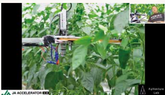
AGRIST 株式会社 がピーマン自動収穫ロボットをオンラインでプレゼン

JAグループが東京・大手町に設立したAgVenture「α(アグベンチャーラボ)」で5月18日に、JAアクセラレータープログラム(第2期)の最終審査コンテストが開かれ、書類・面談選考を通過し最終選考に進んだ14社のうち、同プログラムへ参加する8社を優秀賞として採択しました。 【経営企画部】