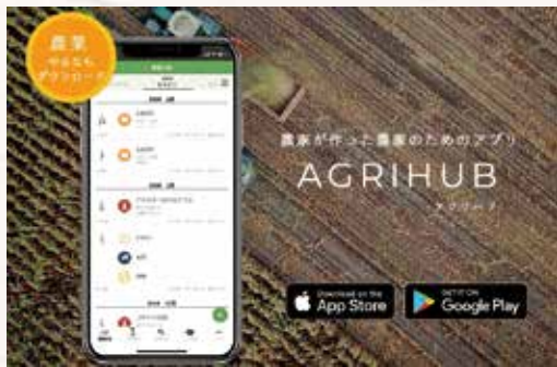
(株)Agrihubのスマートフォンアプリで実現する農業基幹システム