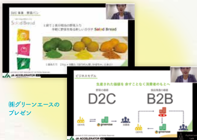
(株)グリーンエースのプレゼン

未利用農産物の粉末化テスト、栄養成分分析、商品案デザイン、商品開発およびマーケティング検証の実施を目標としています。