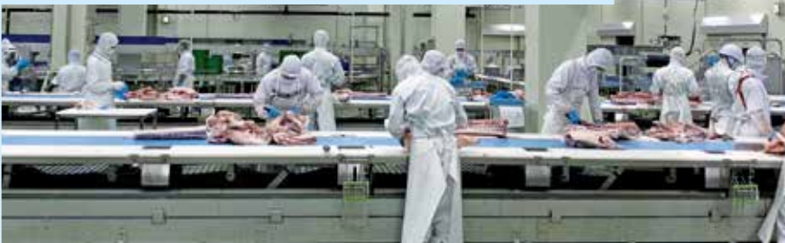
稼働した岩手県本部の関連会社、(株)いわちくの豚処理加工施設(上)と豚肉加工ライン(3面)