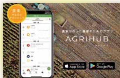
農家が作った農家のためのアプリ「AGRIHUB」