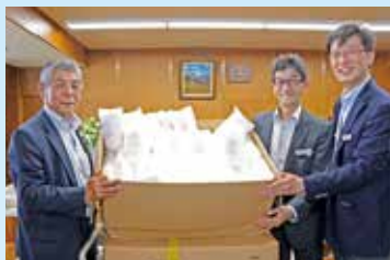
鳥取県本部が新型コロナウイルス感染防止対策支援として、県内JAにマスク3万6000枚を提供＝写真上・JA鳥取いなば、写真下・JA鳥取西部(3面)