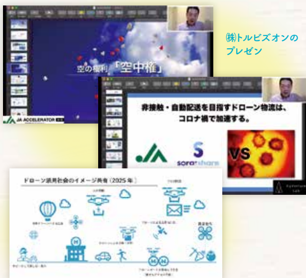
ドローン活用社会のイメージ

既に福岡県内で、自治体や全国森林組合連合会と連携して実証実験を進めており、山口県下関市の一部地区では実際に「空の道」が実現しています。今後のアクセラレータープログラムでは、JA組合員が保有する農地などの土地やA-COOP・JA-SSなどの店舗を活用した空の道を作り、ドローン物流を実現することを目標としています。