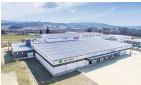
稼働した豚処理加工施設

岩手県本部の関連会社、(株)いわちくは、岩手が誇るブランド牛「いわて牛」をはじめ、首都圏で評価の高い「いわて純情豚」や「味工芸ハム」「エルンテフェスト」(ソーセージ)といった加工品など、多種多様な商品を販売しています。