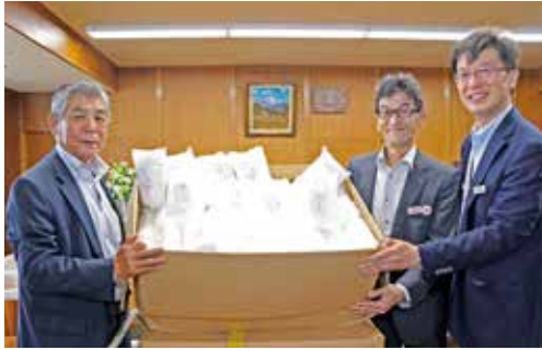
JA・全農の思いをひとつにしようと届けられたマスク（写真上・JA鳥取いなば、写真下・JA鳥取西部）

政府の緊急事態宣言が5月14日、39県で解除されましたが、首都圏を中心に継続された状態が続きました。解除後も第2波の発生が危惧されており、今後も新生活スタイルを導入した感染予防対策の重要性が示されています。