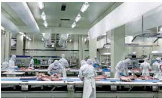
新施設の豚肉加工ライン