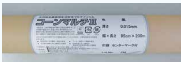
今夏より順次、「きえ太郎Z」に改称予定

また、商品名について、長らく慣れ親しんでいた「コーンマルチII」から「きえ太郎Z」に改称する予定です(今年夏ごろから順次)。