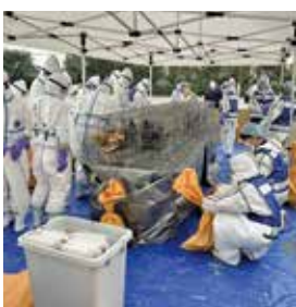
家畜伝染病発生時に対応した防疫対策演習

実現するために、各JAと県内の家畜保健衛生所の連携強化を図ります。県本部の役割としては特に、緊急時における県の依頼に基づく対象地域のJAへの連絡など迅速で円滑な対応が求められます。