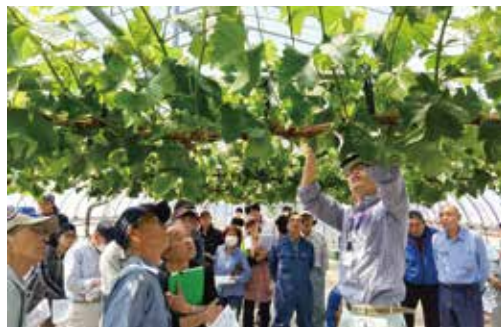
ジベレリン処理・房作り講習会

21年には栽培技術の向上と組織出荷体制による共同販売事業を推進し、安定した農家経営を目指して「JA庄