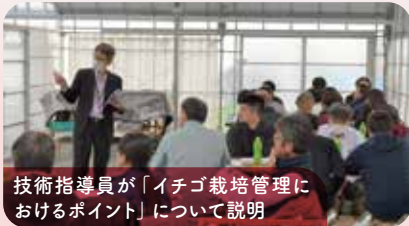
技術指導員が「イチゴ栽培管理におけるポイント」について説明

近年、府内ではイチゴの栽培面積が拡大していますが、イチゴ栽培では高度な技術を要するため、JA職員の対応力強化を目的に研修会を実施しました。