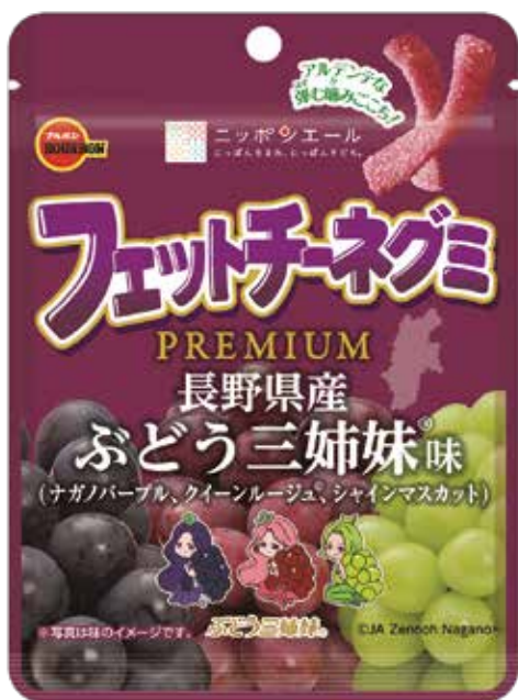
フェットチーネグミPREMIUM 長野県産ぶどう三姉妹 ® 味

ブルボン×ニッポンエール「フェットチーネグミPREMIUM長野県産ぶどう三姉妹 ® 味」は、ブドウ3種の果汁を使用したPREMIUM仕様となっています。「フェットチーネグミ」の特徴である弾むかみ心地とともに、長野県産ブドウのみずみずしい味わいとジューシーな甘みを楽しめます。