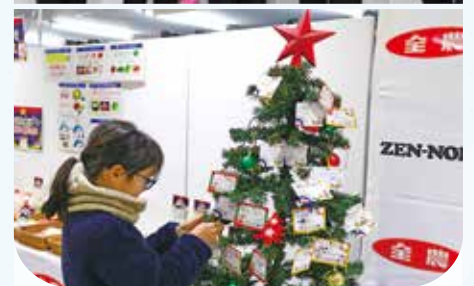
(上) 「もぐもぐブース」で食材を手にするゲストや選手たち (下) クリスマスツリーに夢や目標を飾る選手