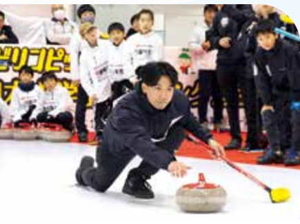
ゲストによるデモンストレーション