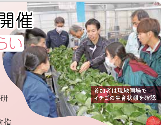
参加者は現地圃場でイチゴの生育状態を確認

研修会では、府本部の農薬技術指導員から「イチゴ栽培管理におけるポイント」として病害虫による被害の特徴・防除方法などの説明をはじめ、全農耕種資材部 西日本営農資材事業所の農薬課担当者から「イチゴハダニゼ